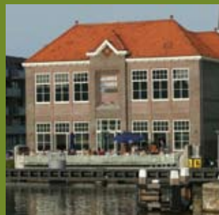
café de Fabriek

Het Blauwe Pand is een oude garage die door de buurt wordt gebruikt voor diverse doeleinden. Het Zaanse bureau voor architectuur en interieurarchitectuur HenNK is er gevestigd. Dit bureau gaf in mei de aftrap voor een grote ontwerp- en bouwwedstrijd voor kinderen uit alle groepen 7 in Zaanstad in het kader van PETZ (Promotie Event Techniek en wetenschap Zaanstad). Alle werkstukken worden op 20 en 21 juni tentoongesteld in Het Blauwe Pand. Op 21 juni vindt de prijsuitreiking plaats. Meer info: kind-en-ruimte.nl/petz-prijsvraag-kinderen/