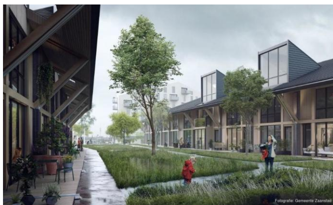
Plan 'Bannenhoven' met veel aandacht en kwaliteit voor de openbare ruimte

Door anders te denken kan er anders gebouwd worden: