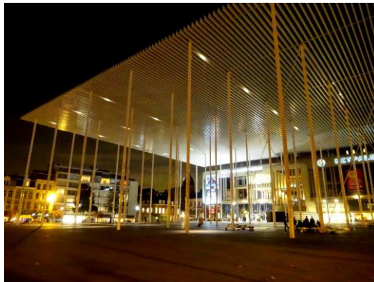
De stadsluifel in Antwerpen op het Theaterplein voor de schouwburg