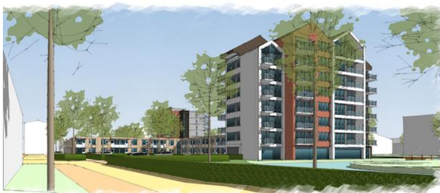
Transformatie van de 'Amandelbloesem' in Wormerveer tot woonvorm voor de huidige/nieuwe tijd: Een buurtwoonhuis voor Inwoners en organisaties, deze faciliteren en de ruimte geven