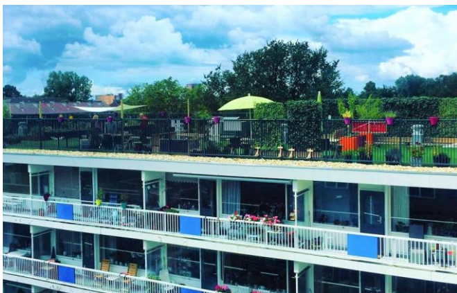
De daktuin op het zorgcentrum 'Pennemes' in Zaandam, goed voor de bewoners en de buurt.