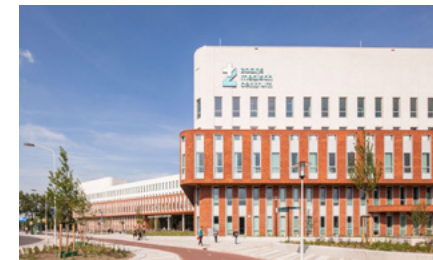
ZMC (foto van Mecanoo)

Het Zaanse Medisch Centrum is het eerste 'lean'-ziekenhuis in Nederland, waarbij efficiëntie, een sterke verbinding met de stad en aandacht voor de beleving van patiënten, zorgpersoneel en bezoekers centraal stonden in het ontwikkel- en ontwerpproces. Maar wat houdt lean precies in, en hoe is de herontwikkeling van het ZMC, inclusief een zorgboulevard en een woningcomplex, tot stand gekomen?