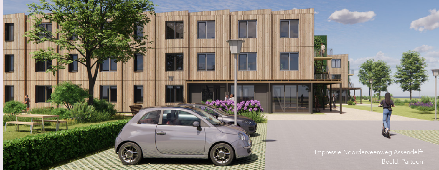
Impressie Noorderveenweg Assendelft

» Bekijk de interviews met 5 woningzoekenden