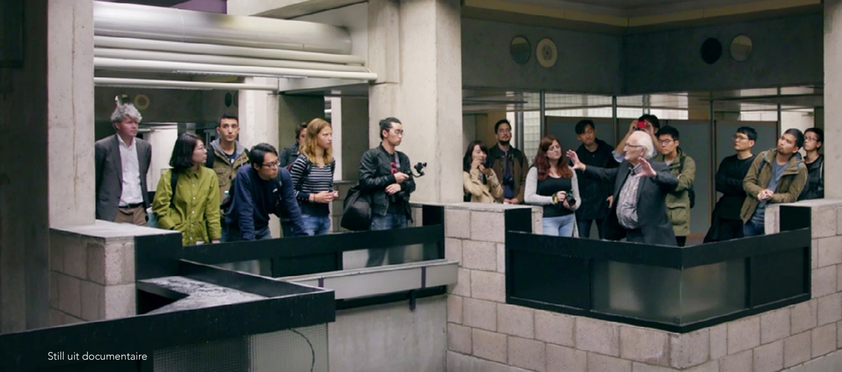
Still uit documentaire