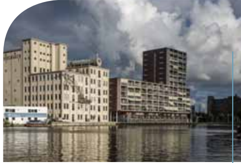
ZWAARDEMAKER (1913), Rijksmonument Architect (origineel): B. Schelling Architect (transformatie): Hooyschuur Architecten (nominatie Nationale Renovatieprijs 2007)